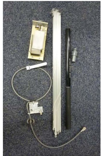
JG1UNE, JR10A0, JA1Q0J, JF1VNR, 石田さん ループ全長約4m. 折りたたむとこのサイズでバックパックに収納！