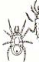
ダニ (0.1~2mm) とても小さい 白、赤、茶色が多い