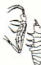
トビムシ (0.5~5mm) 小さくてよくはねる 色はいろいろ