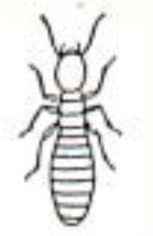
シロアリ (3mm~1cm) 体はくびれてない 黒いものもいる