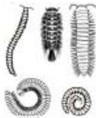
ヤスデ (5mm~5cm) 小さな足がたくさん わりとゆっくり歩く 体を丸めるものもいる