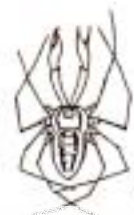
ザトウムシ (1mm~1cm) 細長い足をもつものが多い