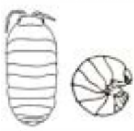
ダンゴムシ (5mm~1.5cm) おしりが丸い 体を丸める