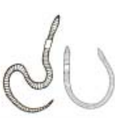
ミミズ (1~20cm 以上) 長くてぬるぬるしている 体に細かいいふしがある

お ば つち なか い もの で した ず さんこう 落ち葉や土の中をのぞいてみると、いろいろな生き物が出てきます。下の図を参考に して、なまえを調べてみましょう（大きさはおおよその 値 です）。