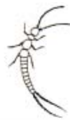
ナガコムシ (5mm~1cm) 色は白っぽい すべるように走る