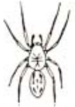
クモ (1mm~4cm) 足は4対 体がくびれている