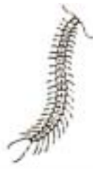
オオムカデ (5~10cm) 足は21~23対 すばやく走る