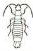
ハサミムシ (5mm~3.5cm) おしりにはさみがある