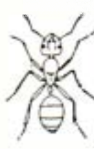
アリ (1mm~1cm) 体がくびれている