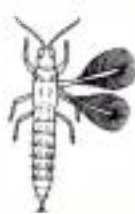
アザミウマ (1~5mm) 体が細長い はねが無いものも